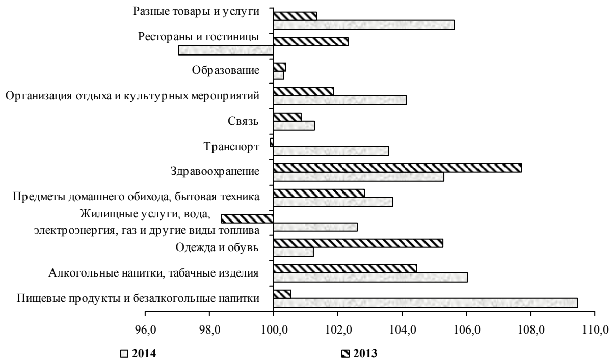
График 2: Индексы потребительских цен и тарифов на товары и услуги по основным группам в I полугодии (в процентах)

С начала т.г. прирост тарифов на услуги, оказываемые населению, в целом составил 2,0 процента. Значительное повышение тарифов с начала т.г. зафиксировано на услуги технического обслуживания и ремонта личных транспортных средств - почти на треть, железнодорожного пассажирского транспорта - на 15,7 процента и воздушного пассажирского транспорта - на 11,7 процента.